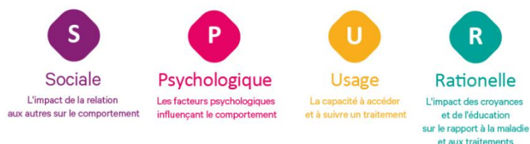
Figure 1 : Les quatre principales dimensions comportementales selon le SPUR

SPUR™ détecte avec précision le risque de non-observance du patient et explicite les raisons de son comportement de santé selon quatre dimensions.